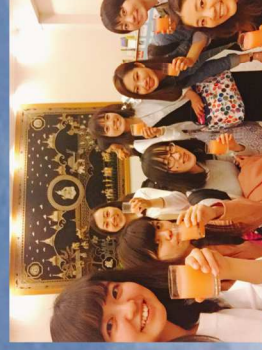
◀ウエルカムドリンクのイチゴジュース